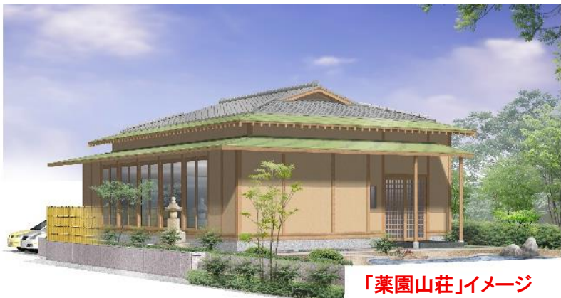
「 薬園山荘 」イメージ

繰り返しになりますが、檀信徒一丸となって当事業の無難成満を目指して参りたいと存じます。よろしくお願いたします。なお、詳細につきましては、別途ご案内をご確認下さいませ。