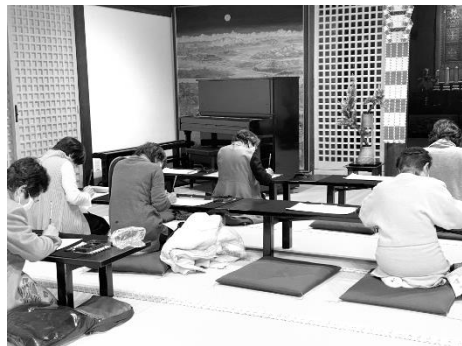
毎月8日、21日に行われる「写経会」