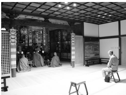
5月当山僧侶のみで行った「本尊大祭」

日々の法務も然りで、年忌法事を延期するという方も少なくなく、実施される場合もごく少人数、会食なし、ということが